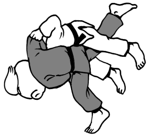
Uchi-mata "benkast variant"