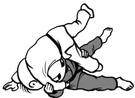
Yoko-otoshi "Laats variant" Obs! Man får inte längre greppa i be- net