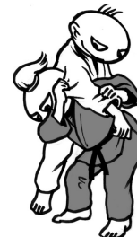
Ippon-seoi-nage variant vänsterkast med attack mot ukes högra arm"